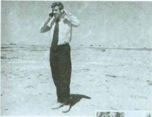
تدقيق ميداني في أثناء التوقّف لإعادة التزوّد بالوقود في قاعدة بَلد الجوية شمال بغداد